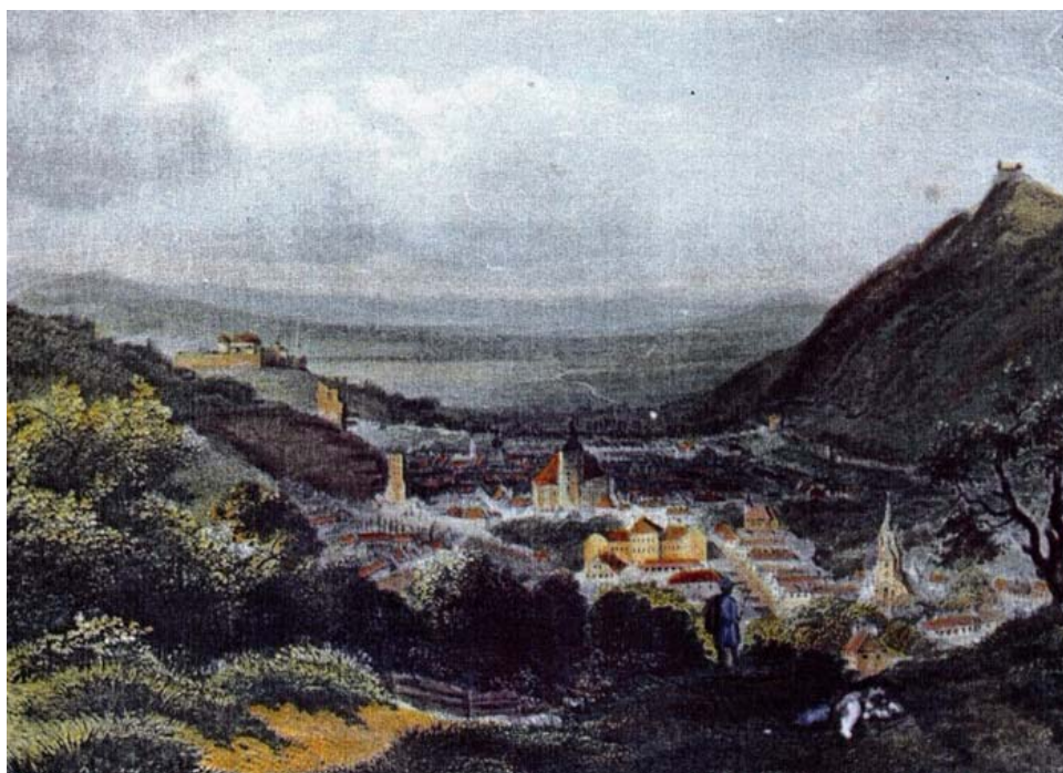
Cetatea Brașov, 1820, vedere spre sud-vest, desen color de L. Rohbock, gravor I. Popel.

Beneficiind de autonomie, privilegiile acordate multiplelor activități comerciale, meșteșugărești, încă din sec. XIV- XV au loc procese de proliferare a breslelor. Gama variată, calitatea, îmbinarea artei cu tehnici inovatoare în producția meșteșugarilor vor duce la creșterea faimei produselor Brașovului. Cetatea se va transforma într-un important centru de fabricare și export, cu o continuă creștere a ponderii producției meșteșugărești și a comercializării.