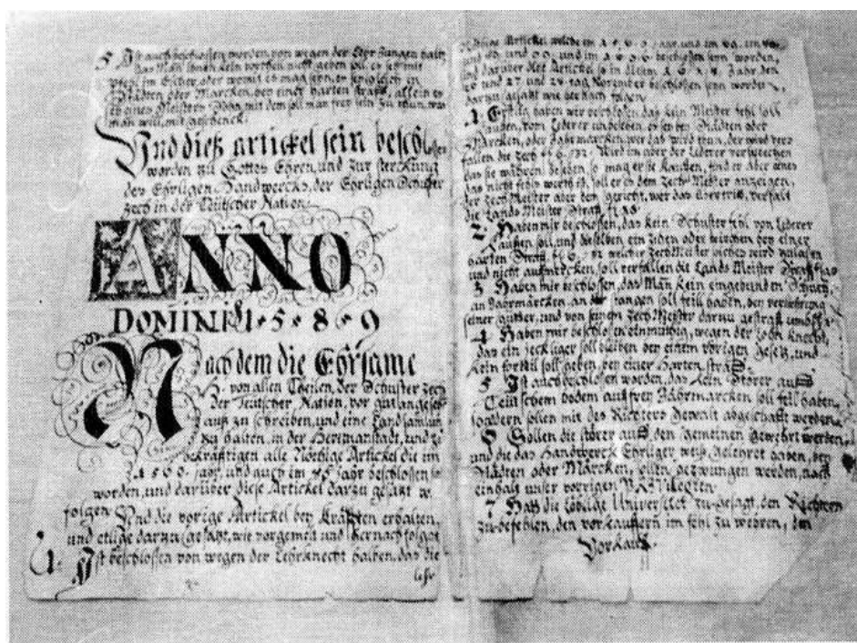
Statut de breaslă, 1589 (Colecția Muzeului de istorie Brașov).

gamei produselor încorporabile anumitor meserii, accentuându-se și delimitarea competențelor. Apar, astfel, în sec. XV- XVI- XVII - XVIII statute ale breslelor aurarilor, alămarilor, postăvarilor, cositorarilor, strungarilor în cositor, frânghierilor, tunzătorilor de postav, țesătorilor de pânză, cuțitarilor, olarilor, năsturarilor, strungarilor în os, apoi ale argintarilor ș.a. Toate se constituie ca organizații profesionale, în scopul stabilirii de reguli pentru procurarea de materii prime, desfacerii produselor, în scopul apărării intereselor breslei respective. Aveau statute proprii, consiliu de meșteri, erau persoane juridice, cu proprietăți formate din bunuri mobiliare și imobiliare, cu sediu, întruniri periodice, serbări specifice. Fiecare breaslă deținea o ladă cu însemne caracteristice în care se depozitau statutele, sigiliul, privilegiile, convocatorul de întruniri.