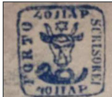
Fig. 18 - a doua emisiune de timbre din 1858