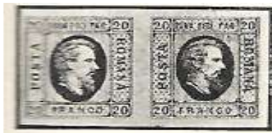
Fig. 20. Prima emisiune

1864 (Fig. 20) și alta în 1865 (Fig. 21). Emiterea acestor timbre s-a făcut în baza Decretului aprobat de către domnitorul Alexandru Ioan Cuza, la data de 12 Octombrie 1864 12 .