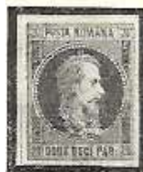
Fig. 21. A doua emisiune

Reformele domnitorului Alexandru Ioan Cuza au avut loc și în serviciile poștale. Bazele poștei moderne au fost puse în 1864 de către domnitorul Alexandru Ioan Cuza, care a unit serviciul