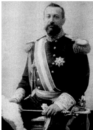
Foto nr. 1 – ASS Prințul Albert I de Monaco (1848–1922), căpitan de marină, „șef și promotor al oceanografiei”, primul președinte al CIESM

În anul următor, E. Racoviță, datorită foarte numeroaselor sale demnități și îndatoriri proprii, recomandă în spiritul cel mai altruist, generos și modest, pe G. Antipa să-i succedă în calitatea de delegat național, acesta fiind nominalizat în mod oficial la 1 ianuarie 1927.