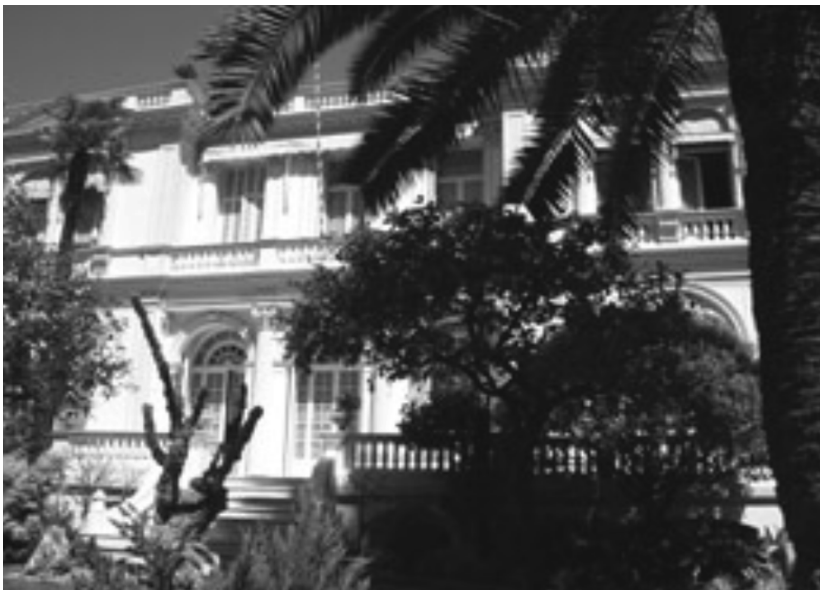
Foto nr. 4 – Sediul actual al CIESM „Via Girasole”, Bd. de Suisse, nr. 16, Monte Carlo/Monaco (concesionat prin Acordul dintre Guvernul Principatului Monaco și CIESM, pe durata a 99 de ani, semnat la Monaco, în prezența delegaților naționali, la 4 decembrie 2009)